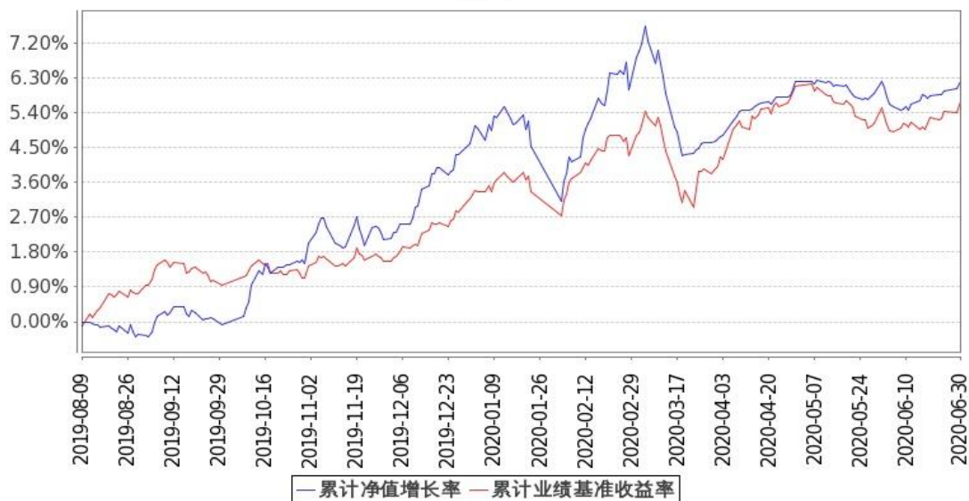
图 1：嘉实新添益定期混合 A 基金份额累计净值增长率与同期业绩比较基准收益率的历史走势对比图