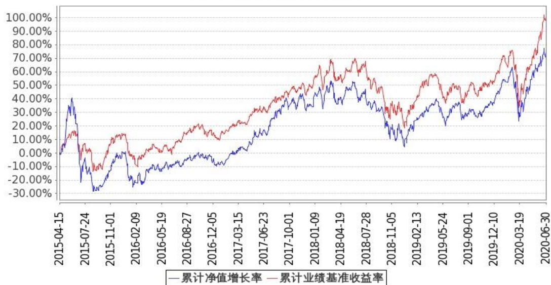
图 2: 嘉实全球互联网股票型证券投资基金-美元基金份额累计净值增长率与同期业绩比较基准收益率的历史走势对比图