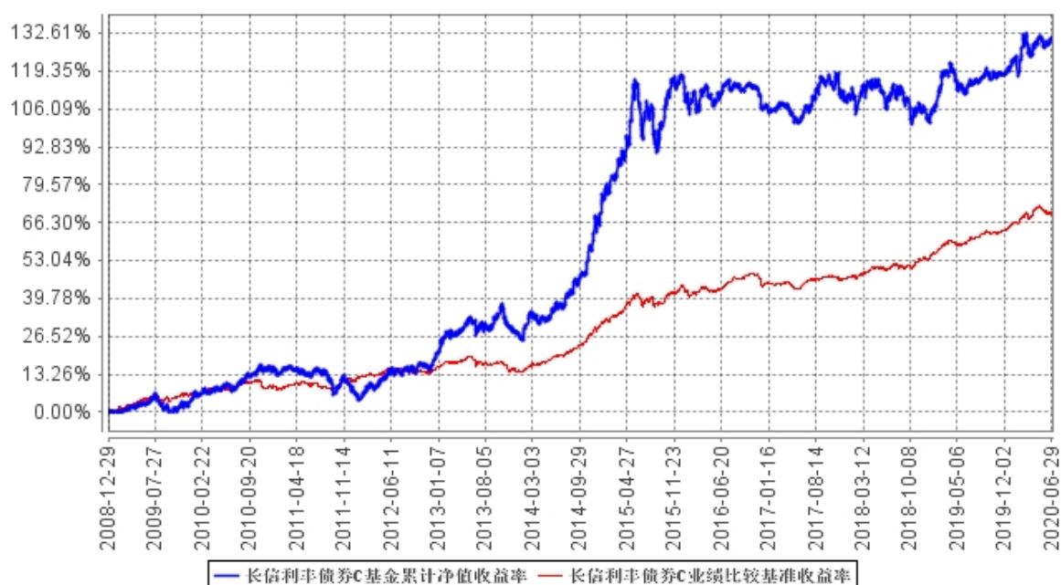
长信利丰债券C基金累计净值收益率与同期业绩比较基准收益率的历史走势对比图