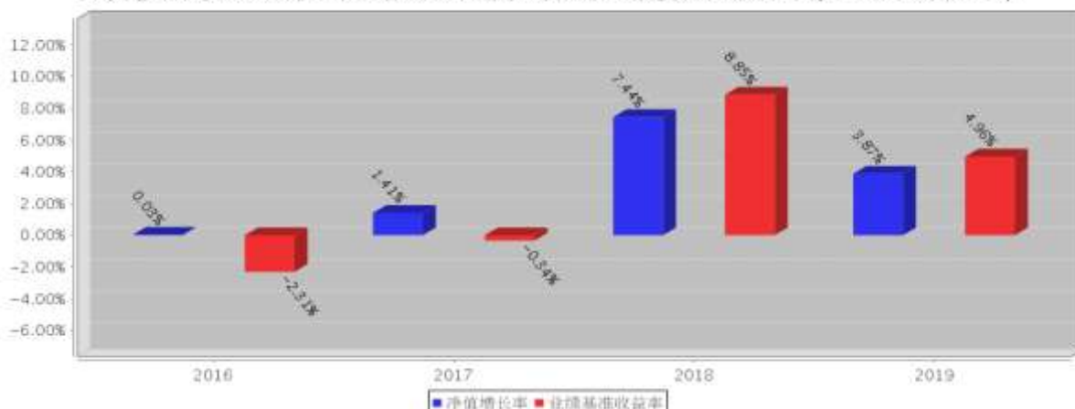
平安惠享纯债A基金每年净值增长率与同期业绩比较基准收益率的对比图(2019年12月31日)