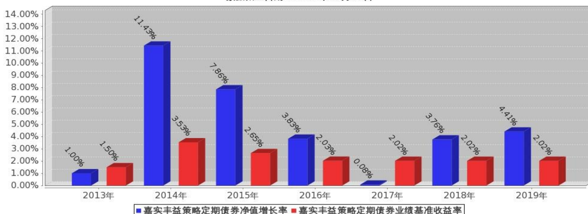
嘉实丰益策略定期债券基金每年净值增长率与同期业绩比较基准收益率的对比图 数据截止日期：2019年12月31日

注:基金的过往业绩不代表未来表现;基金合同生效当年的相关数据根据当年实际存续期计算。