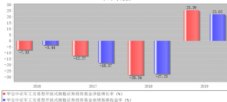
华宝中证军工交易型开放式指数证券投资基金每年净值增长率与同期业绩比较基准收益率的对比图