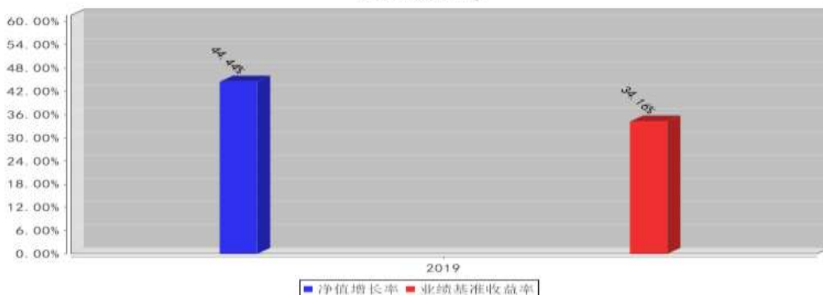
泰达宏利沪深300A基金每年净值增长率与同期业绩比较基准收益率的对比图(2019年12月31日)

注：本基金转型之日为 2018 年 3 月 16 日，2018 年度净值增长率的计算期间为 2018 年 3 月 16 日至 2018 年