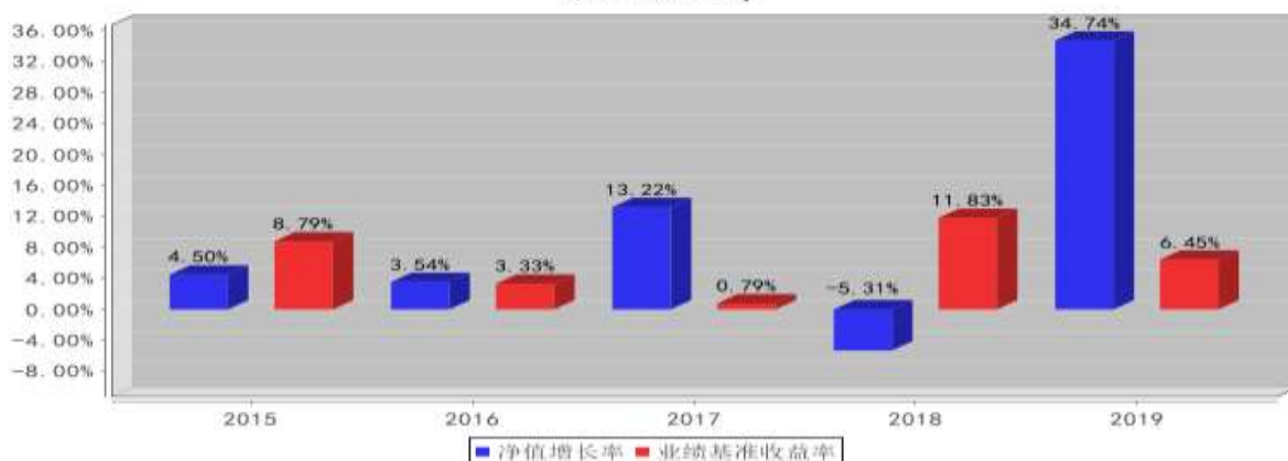
泰达宏利创盈混合A基金每年净值增长率与同期业绩比较基准收益率的对比图(2019年12月31日)

注：本基金合同生效日为2015年3月30日，2015年度净值增长率的计算期间为2015年3月30日至2015年12月31日。基金的过往业绩不代表未来表现。