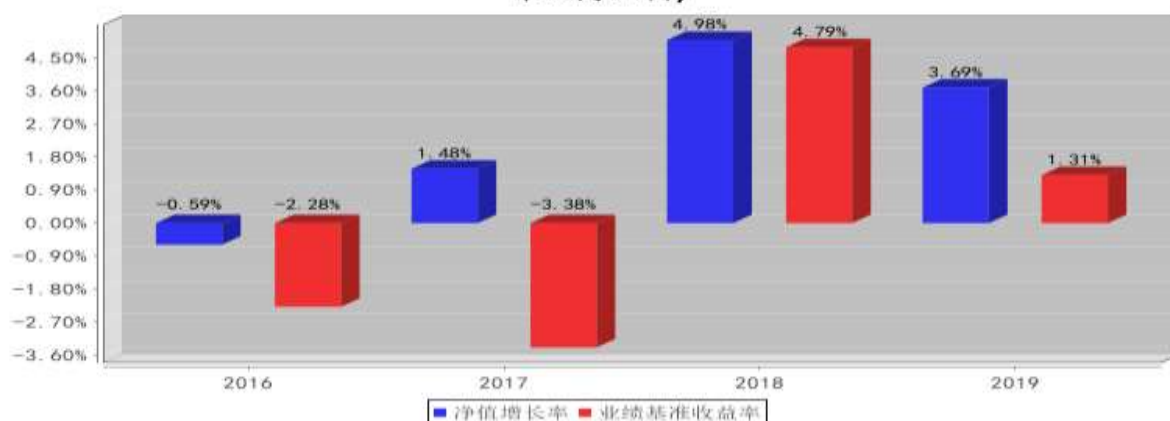
泰达宏利汇利债券A基金每年净值增长率与同期业绩比较基准收益率的对比图(2019年12月31日)

注：本基金合同生效日为2016年8月30日，2016年度净值增长率的计算期间为2016年8月30日至2016年12月31日。基金的过往业绩不代表未来表现。