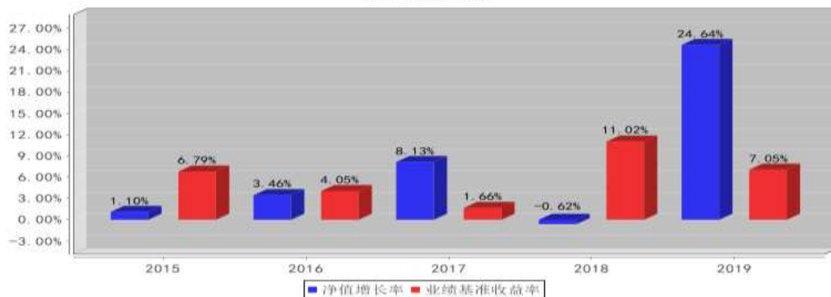
泰达宏利创益混合A基金每年净值增长率与同期业绩比较基准收益率的对比图(2019年12月31日)

注: 本基金A类份额合同生效日为2015年6月16日, 2015年度净值增长率的计算期间为2015年6月16日至2015年12月31日。基金的过往业绩不代表未来表现。