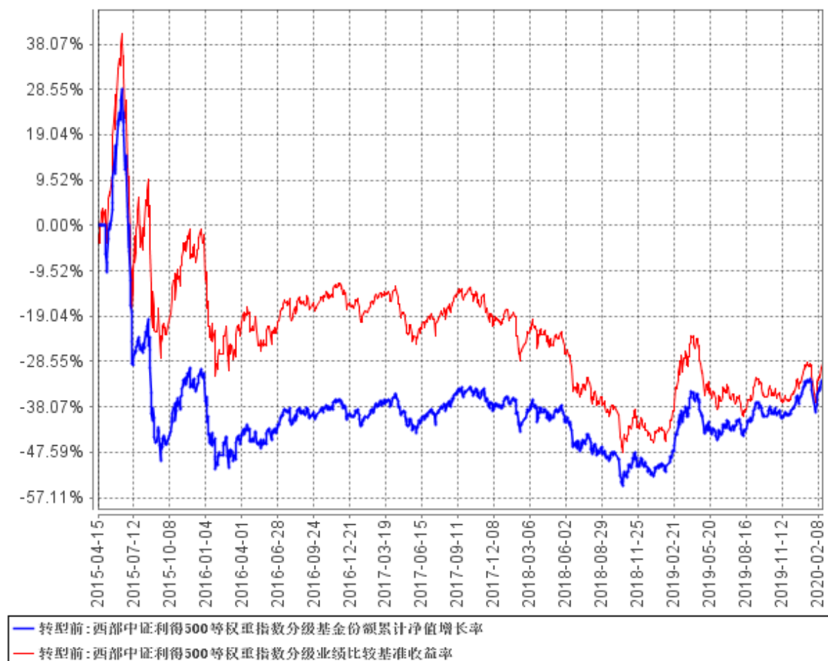
西部中证利得500等权重指数分级基金份额累计净值增长率与同期业绩比较基准收益率的历史走势对比图

注：本基金自 2020 年 2 月 19 日由股票分级类基金转型为指数增强型基金