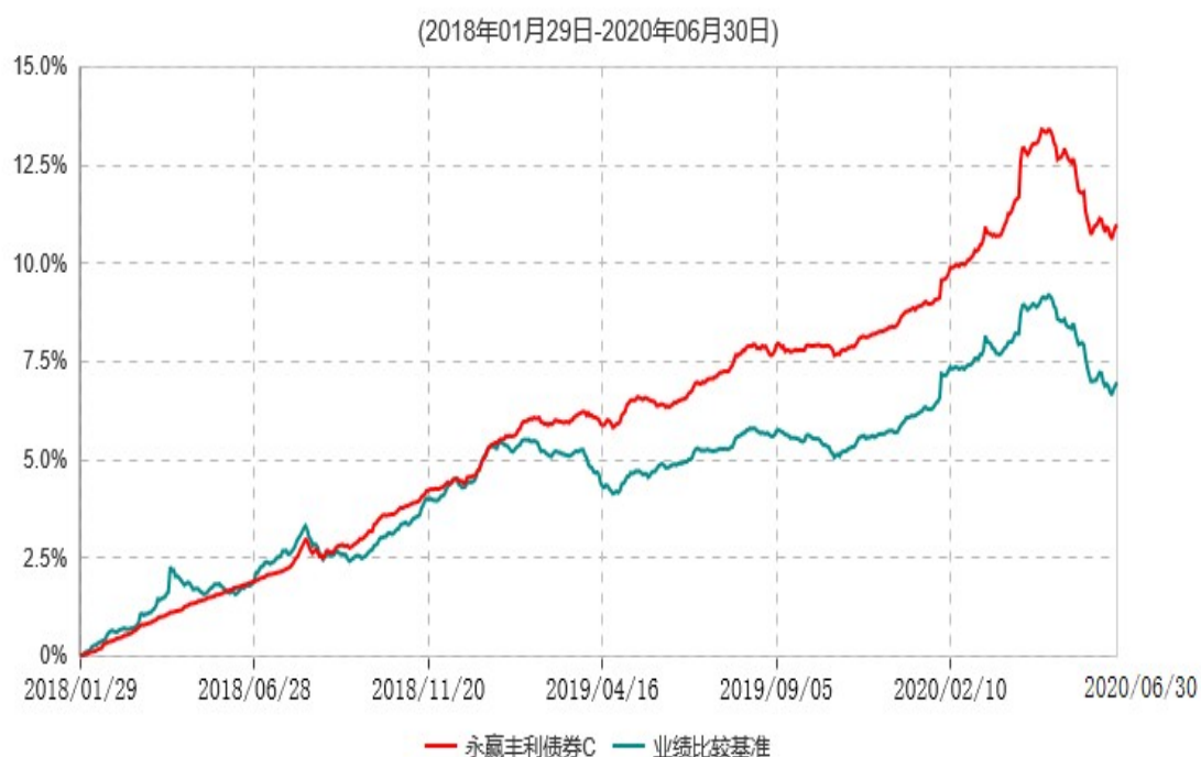
永赢丰利债券C累计净值增长率与业绩比较基准收益率历史走势对比图