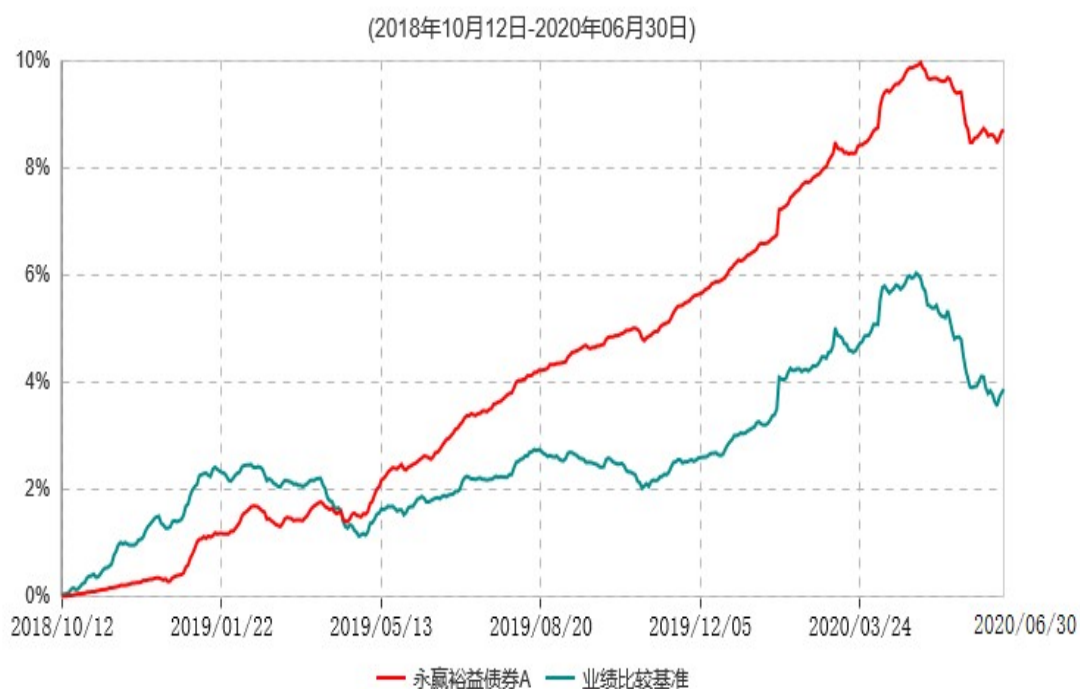
永赢裕益债券A累计净值增长率与业绩比较基准收益率历史走势对比图