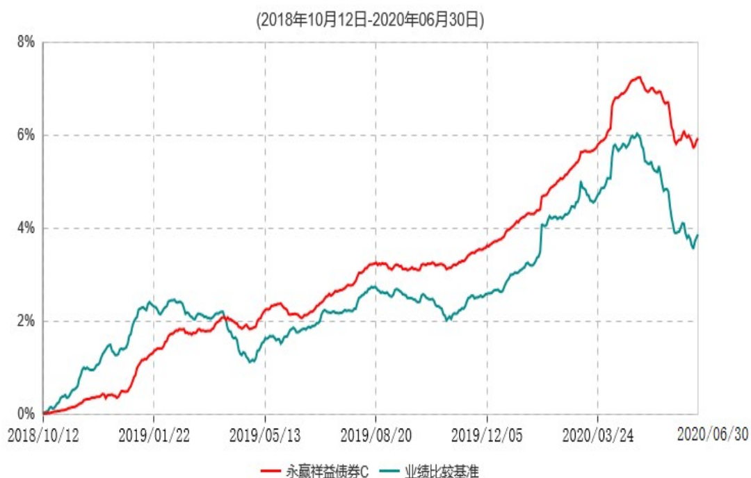
永赢祥益债券C累计净值增长率与业绩比较基准收益率历史走势对比图