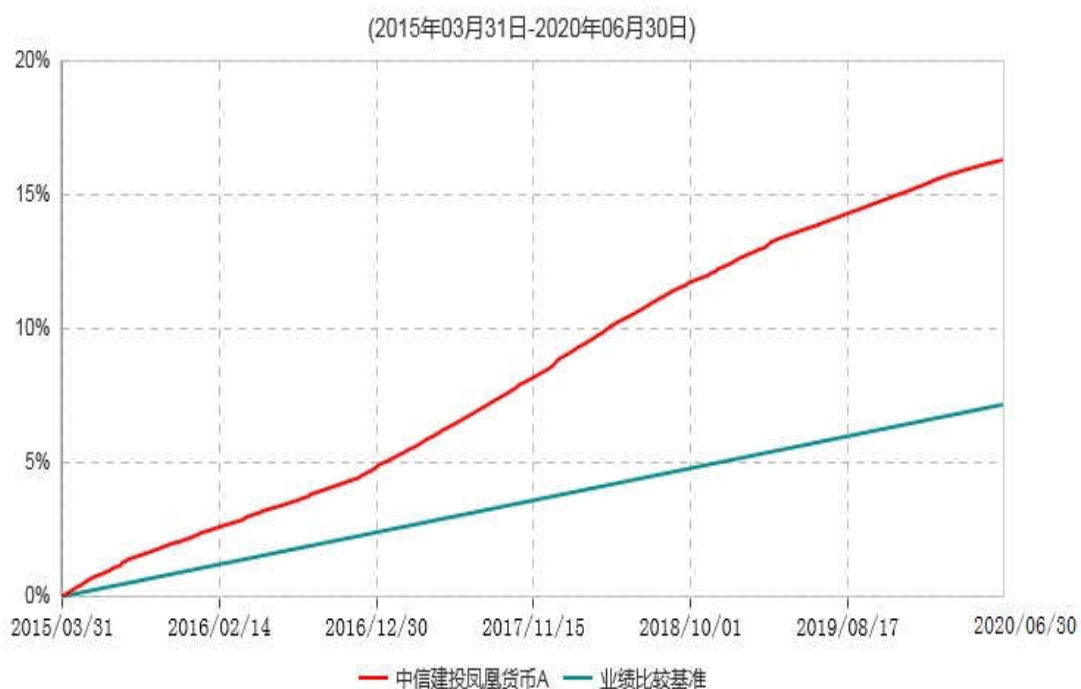
中信建投凤凰货币A累计净值收益率与业绩比较基准收益率历史走势对比图