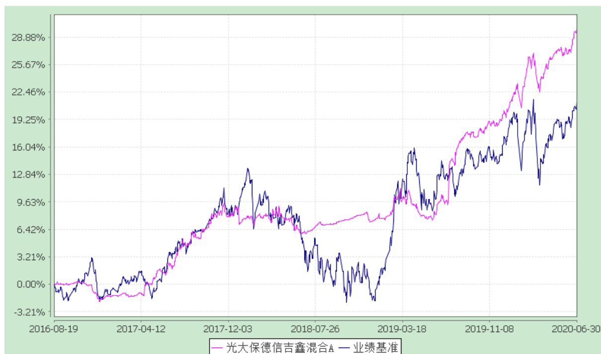
光大保德信吉鑫混合 C