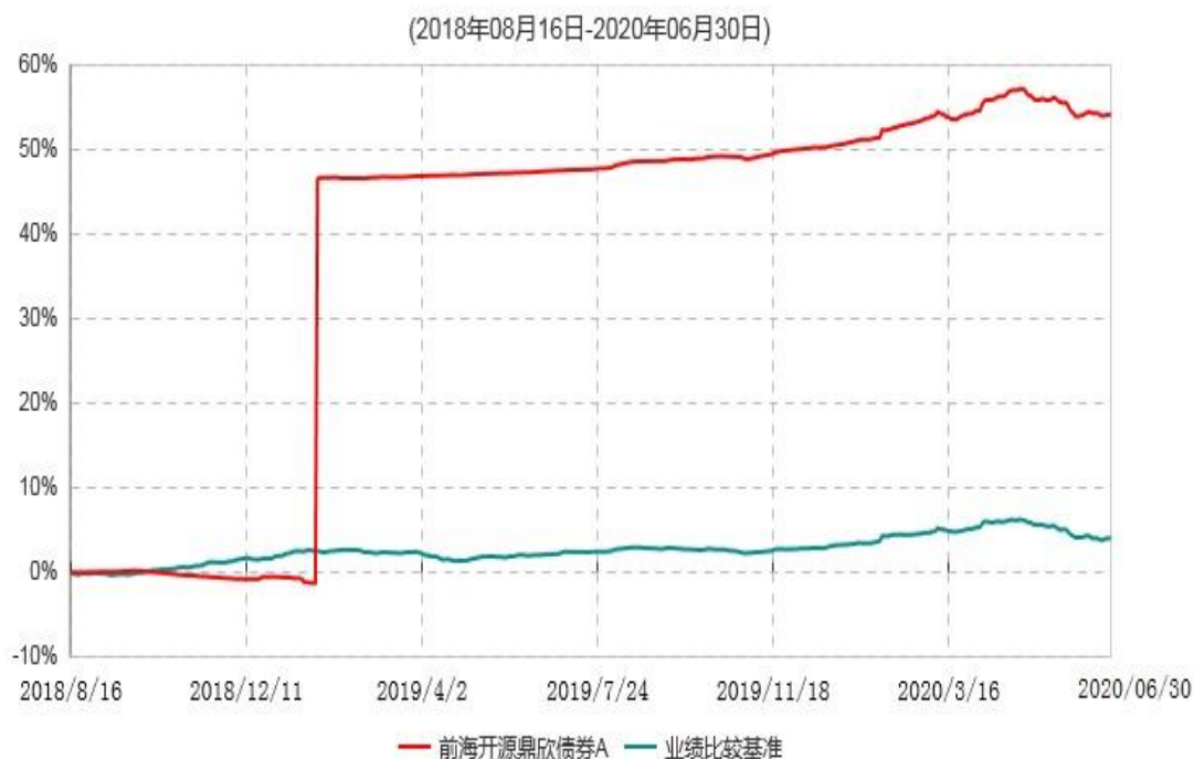
前海开源鼎欣债券A累计净值增长率与业绩比较基准收益率历史走势对比图