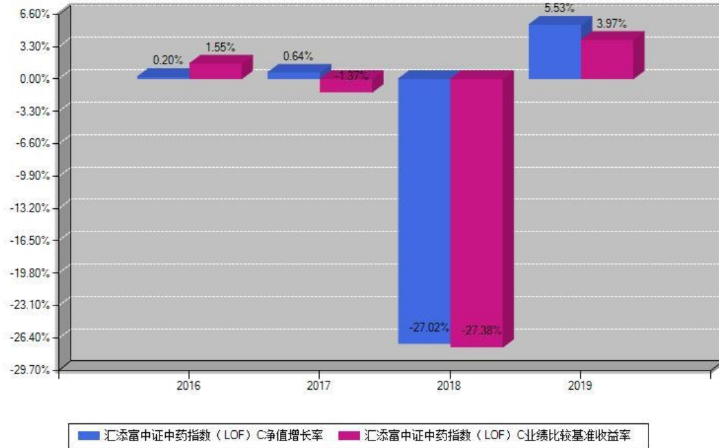
汇添富中证中药指数（LOF）C每年净值增长率与同期业绩基准收益率对比图

注：基金的过往业绩不代表未来表现。本《基金合同》生效之日为2016年12月29日，合同生效当年按实际存续期计算，不按整个自然年度进行折算。