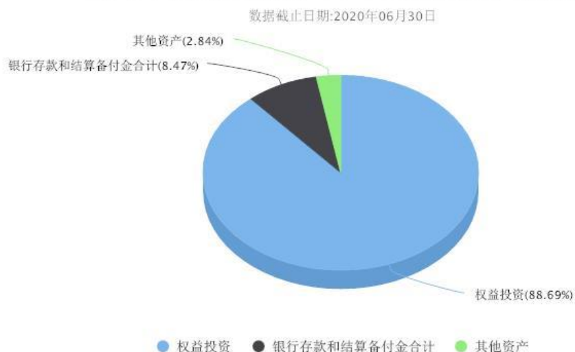
汇添富中证生物科技指数（LOF）C投资组合资产配置图表