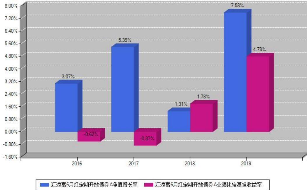
汇添富6月红定期开放债券A每年净值增长率与同期业绩基准收益率对比图

注：基金的过往业绩不代表未来表现。本《基金合同》生效之日为2016年02月17日，合同生效当年按实际存续期计算，不按整个自然年度进行折算。