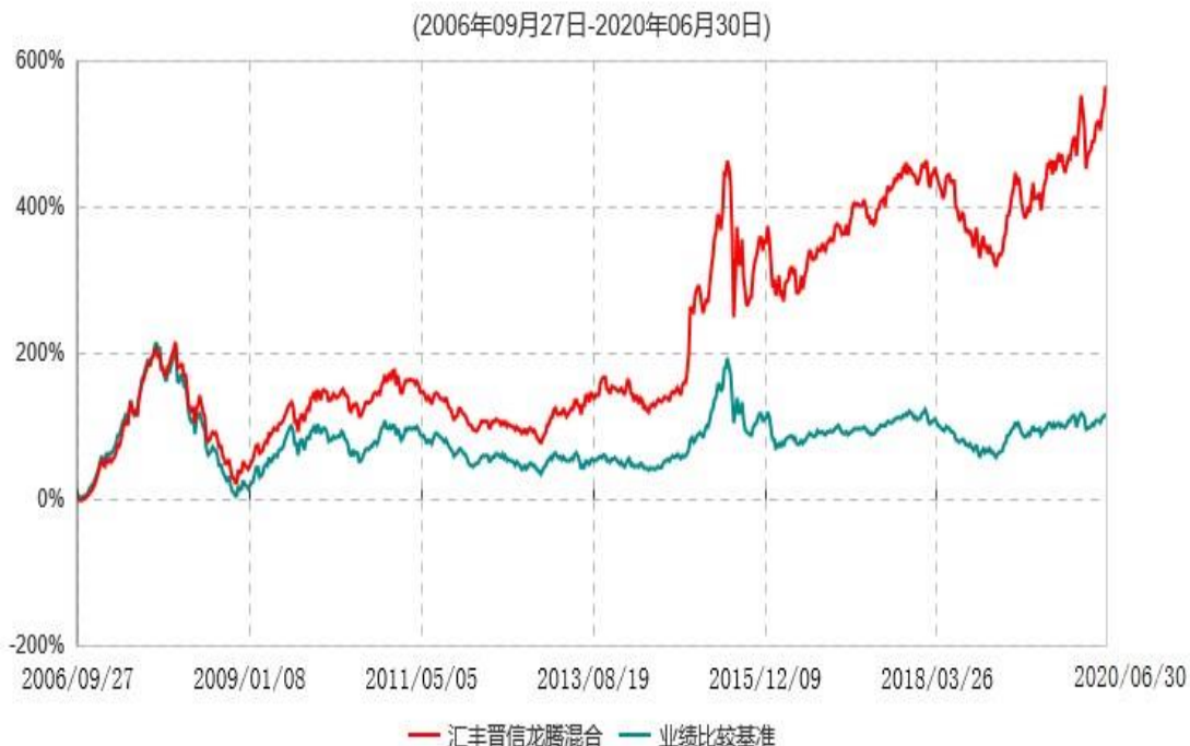
汇丰晋信龙腾混合型证券投资基金累计净值增长率与业绩比较基准收益率历史走势对比图

注：1.按照基金合同的约定，本基金的投资组合比例为：股票占基金资产的60%-95%；除股票以外的其他资产占基金资产的5%-40%，其中现金或到期日在一年期以内的国债的比例合计不低于基金资产净值的5%。本基金自基金合同生效日起不超过6个月内完成建仓。截止2007年3月27日，本基金的各项投资比例已达到基金合同约定的比例。