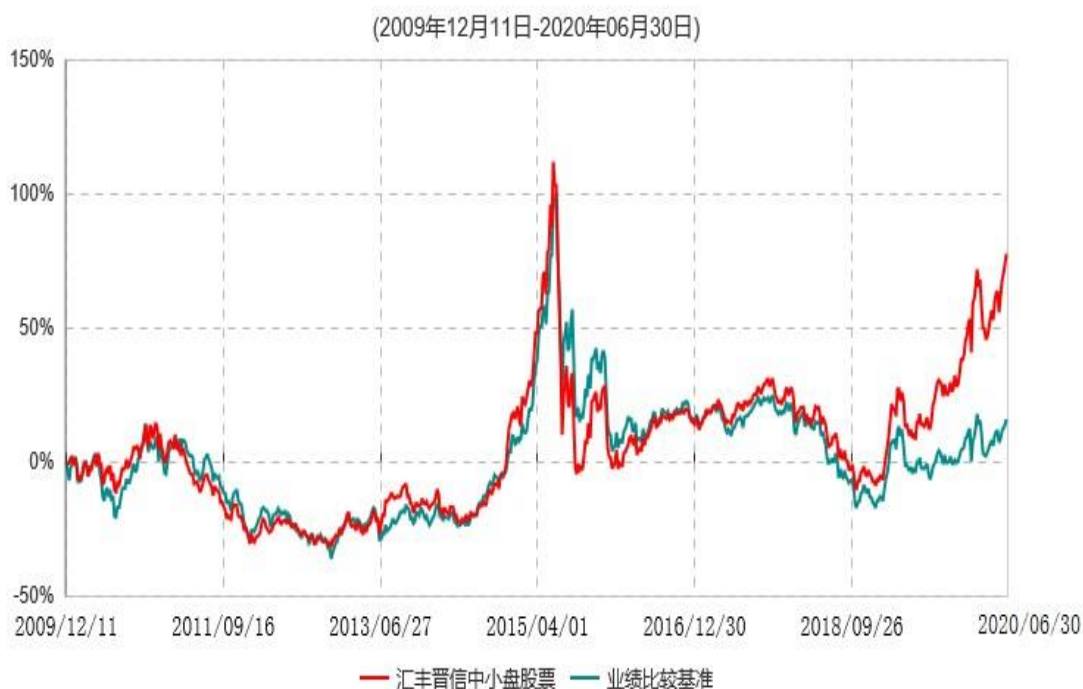
汇丰晋信中小盘股票型证券投资基金累计净值增长率与业绩比较基准收益率历史走势对比图

注：1. 按照基金合同的约定，本基金的股票投资比例范围为基金资产的 85%-95%，其中，将不低于 80%的股票资产投资于国内 A 股市场上具有良好成长性和基本面良好的中小上市公司股票。本基金权证投资比例范围为基金资产净值的 0%-3%。本基金固定收益类证券和现金投资比例范围为基金资产的 5%-15%，其中现金（不包括结算备付金、存出保证金、应收申购款等）或到期日在一年以内的政府债券的投资比例不低于基金资产净值的 5%。按照基金合同的约定，本基金自基金合同生效日起不超过 6 个月内完成建仓，截止 2010 年 6 月 11 日，本基金的各项投资比例已达到基金合同约定的比例。