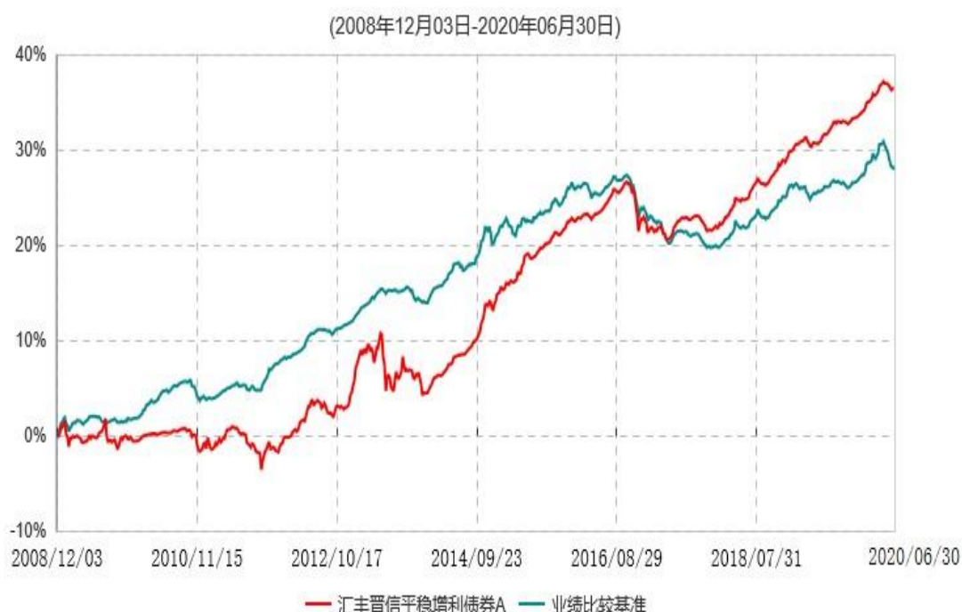
汇丰晋信平稳增利债券A累计净值增长率与业绩比较基准收益率历史走势对比图

注：1. 按照基金合同的约定，本基金主要投资于具有较高息票率的债券品种，包括国债、企业债、公司债、短期融资券、资产支持证券(含资产收益计划)、可转换债券等，投资比例不低于基金资产的 80%，现金或者到期日在一年以内的政府债券不低于基金资产净值的 5%，现金不包括结算备付金、存出保证金、应收申购款等。按照基金合同的约定，本基金自基金合同生效日起不超过 6 个月内完成建仓，截止 2009 年 6 月 3 日，本基金的各项投资比例已达到基金合同约定的比例。