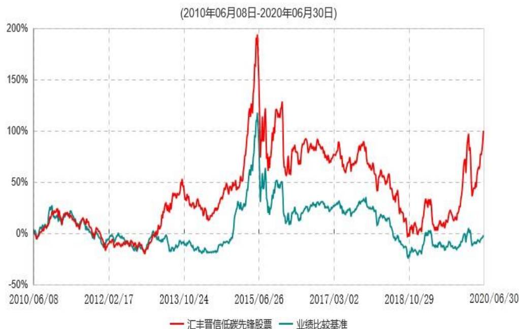
汇丰晋信低碳先锋股票型证券投资基金累计净值增长率与业绩比较基准收益率历史走势对比图