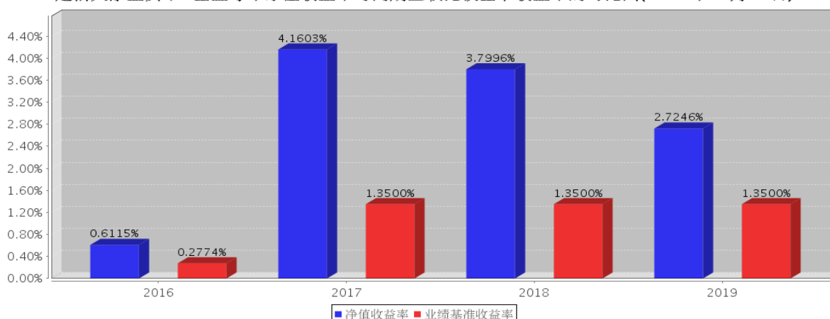
建信天添益货币A基金每年净值收益率与同期业绩比较基准收益率的对比图(2019年12月31日)