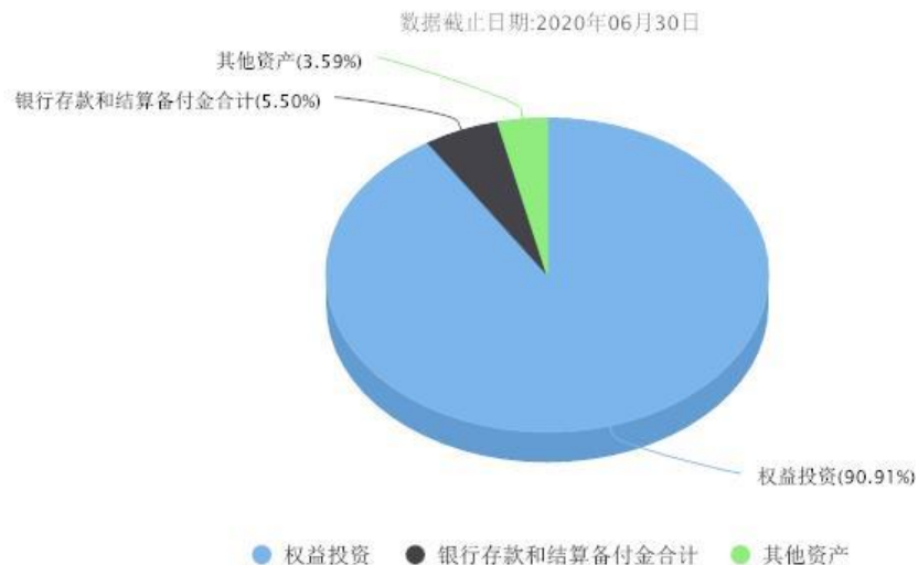
汇添富中证港股通高股息投资指数(LOF)A投资组合资产配置图表