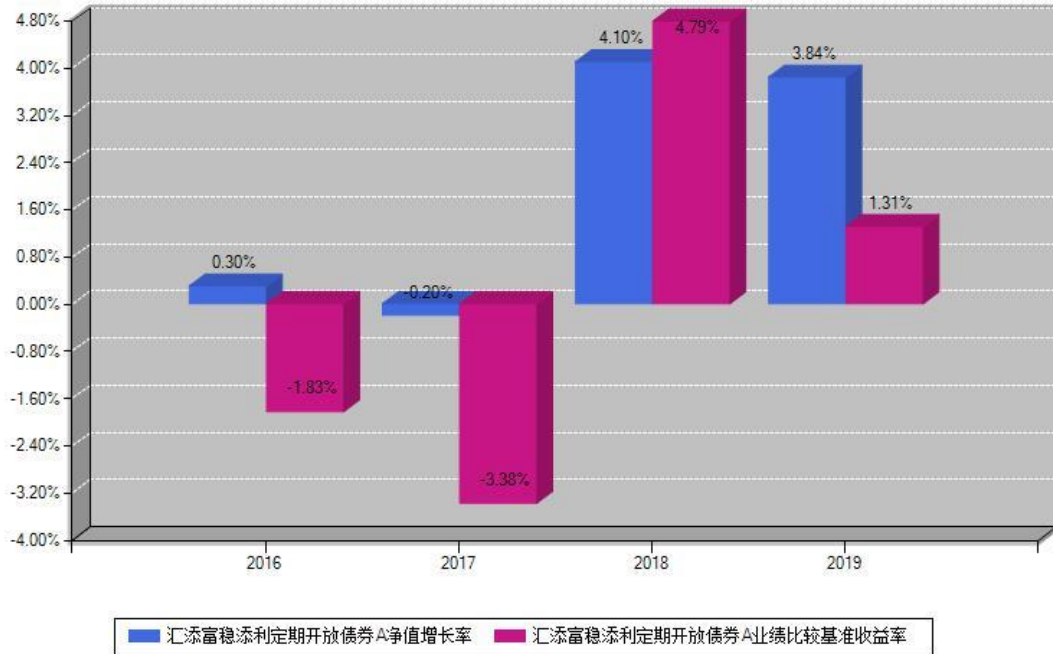
汇添富稳添利定期开放债券A每年净值增长率与同期业绩基准收益率对比图

注：基金的过往业绩不代表未来表现。本《基金合同》生效之日为2016年03月16日，合同生效当年按实际存续期计算，不按整个自然年度进行折算。