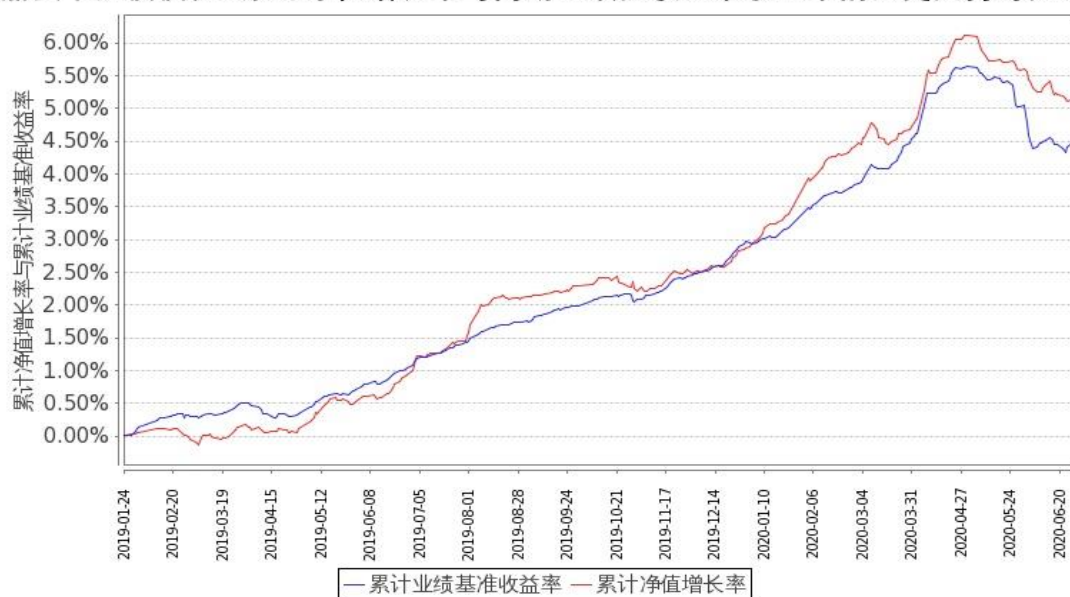
嘉实中短债债券C累计净值增长率与同期业绩比较基准收益率的历史走势对比图