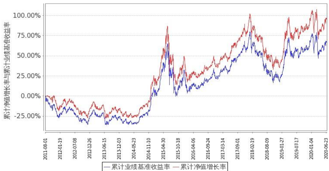
图 1：嘉实深证基本面 120ETF 联接 A 基金份额累计净值增长率与同期业绩比较基准收益率的历史走势对比图