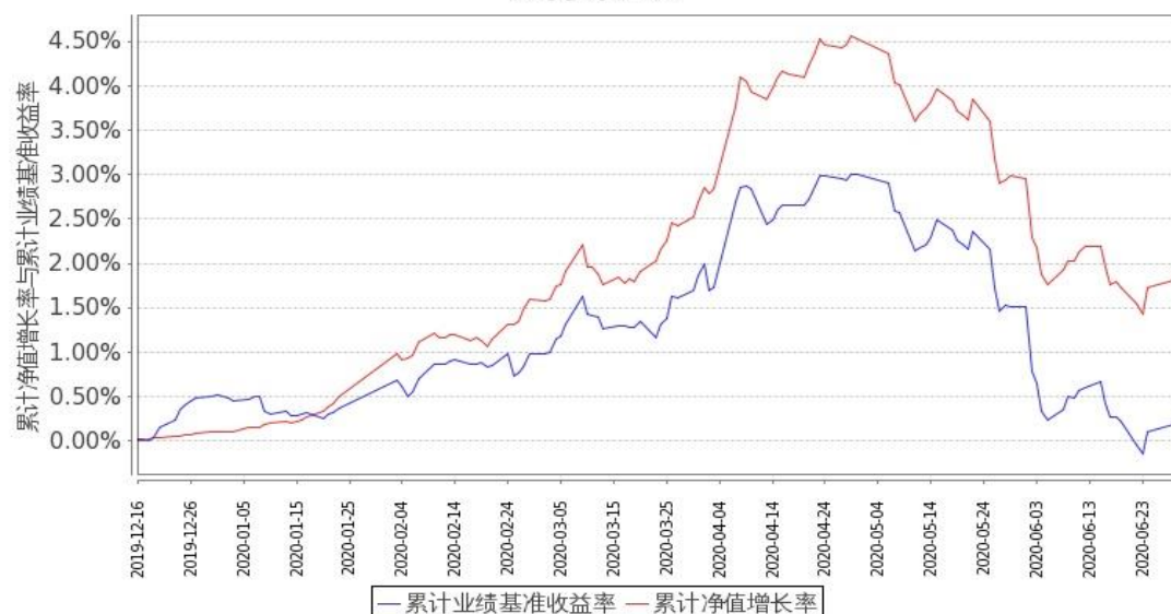
图 2：嘉实中债 3-5 年国开债指数 C 基金份额累计净值增长率与同期业绩比较基准收益率的历史走势对比图