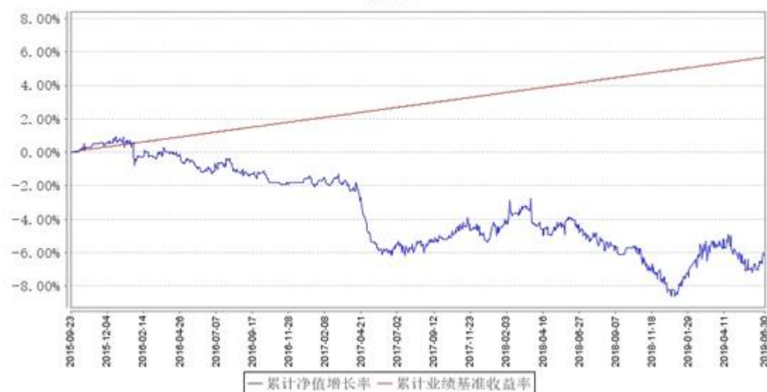
大成绝对收益混合发起A累计净值增长率与同期业绩比较基准收益率的历史走势对比图