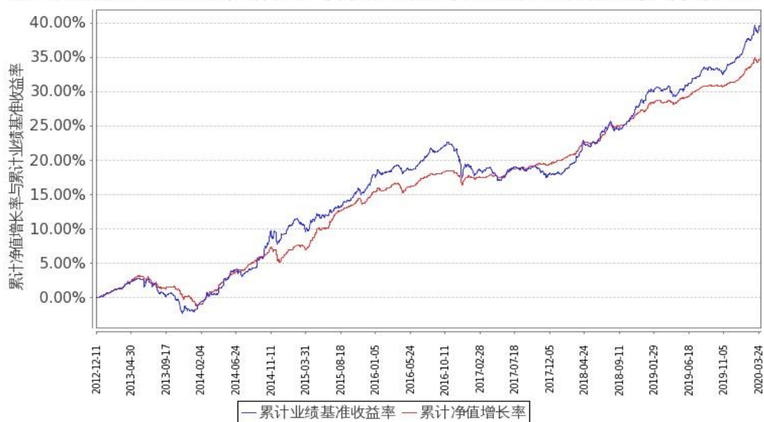
图 2：嘉实纯债债券 C 基金份额累计净值增长率与同期业绩比较基准收益率的历史走势对比