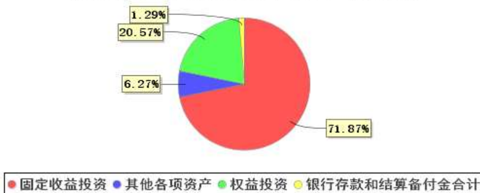
投资组合资产配置图表(2020年6月30日)