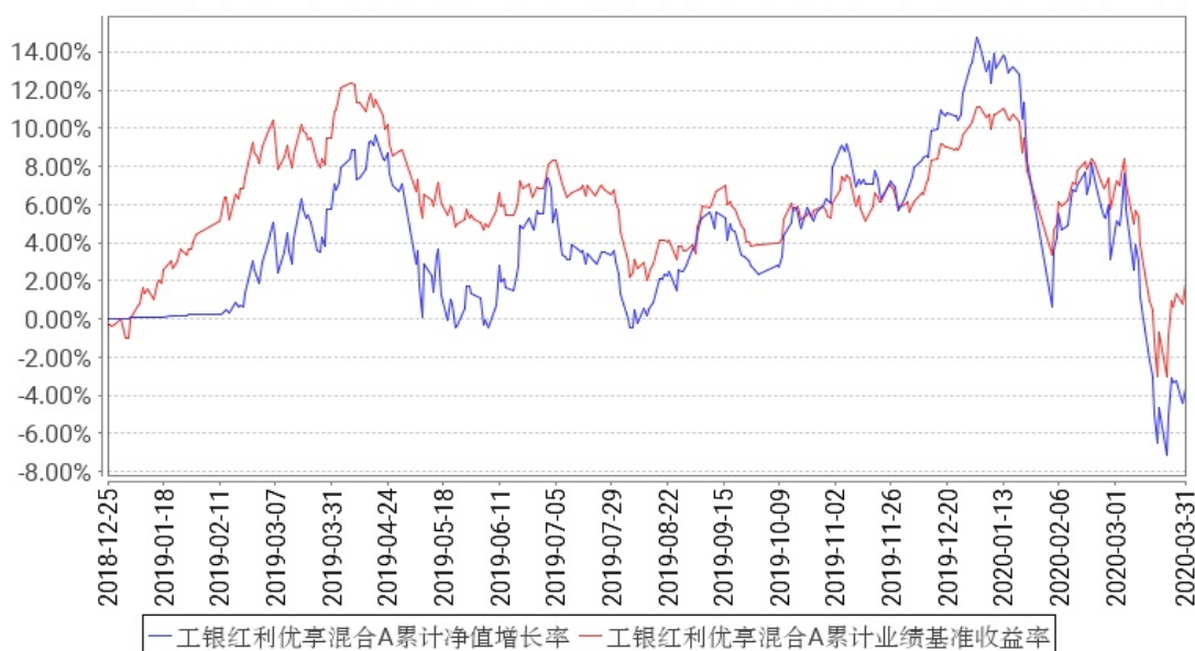
工银红利优享混合A累计净值增长率与同期业绩比较基准收益率的历史走势对比图