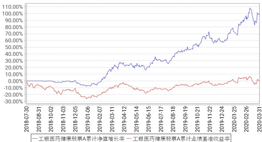
工银医药健康股票A累计净值增长率与同期业绩比较基准收益率的历史走势对比图