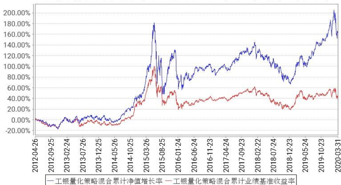
工银量化策略混合累计净值增长率与同期业绩比较基准收益率的历史走势对比图