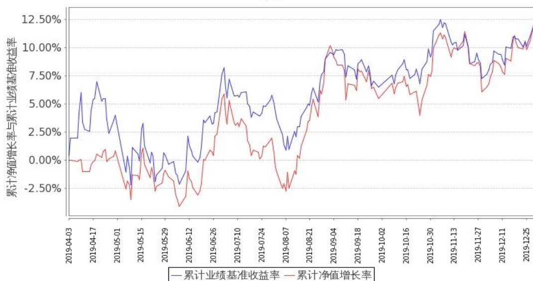
图 2: 嘉实消费精选股票 C 基金份额累计净值增长率与同期业绩比较基准收益率的历史走势对比图