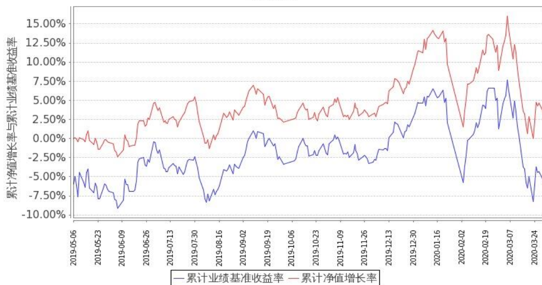
图 2：嘉实长青竞争优势股票 C 基金份额累计净值增长率与同期业绩比较基准收益率的历史走势对比图