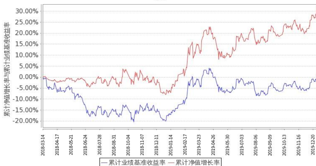
图 2：嘉实金融精选股票 C 基金份额累计净值增长率与同期业绩比较基准收益率的历史走势对比图