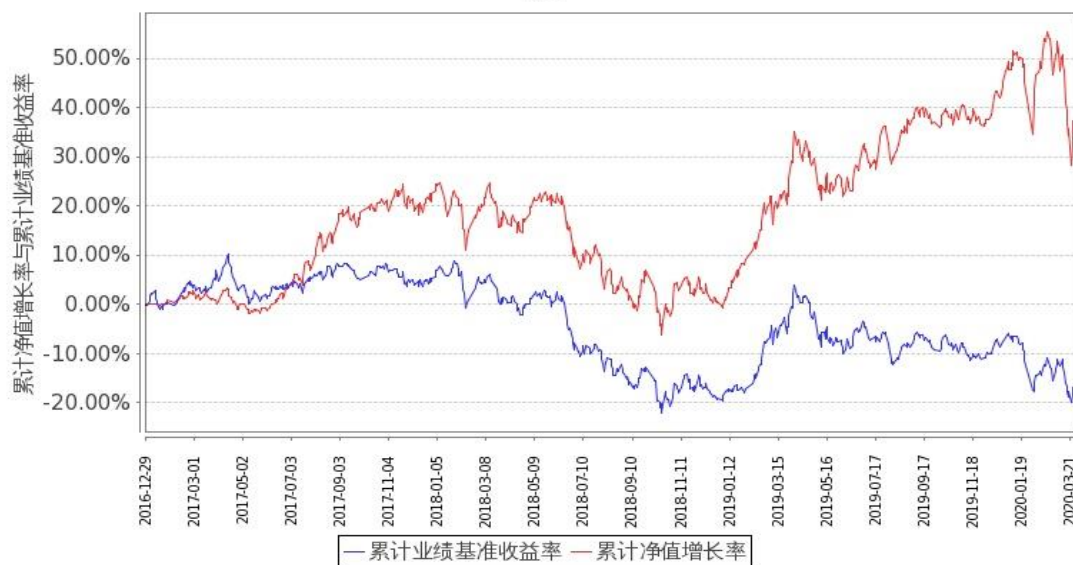
图 2：嘉实物流产业股票 C 基金份额累计净值增长率与同期业绩比较基准收益率的历史走势对比图