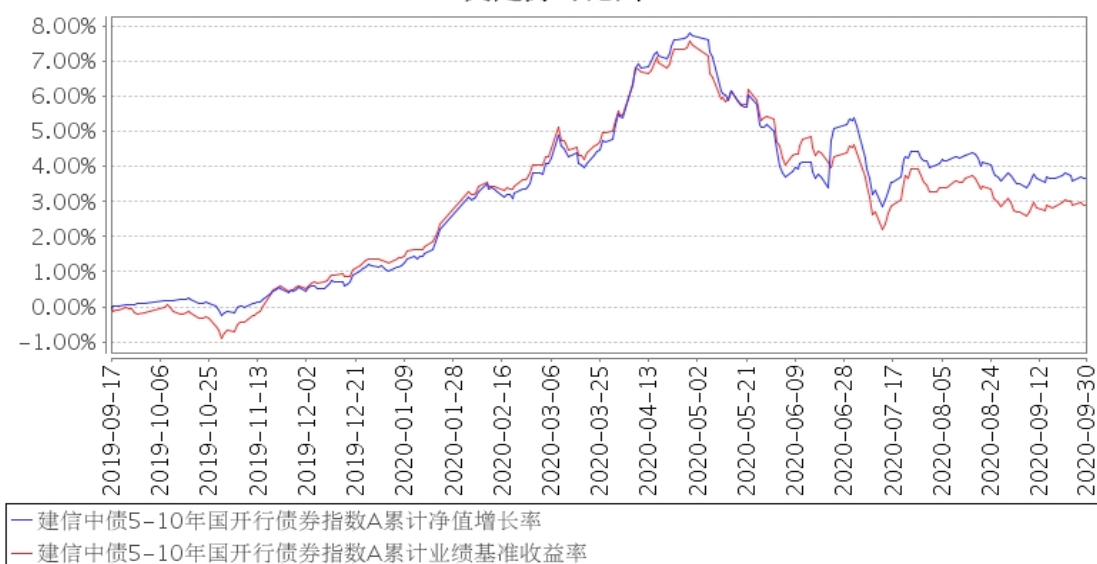
建信中债5-10年国开行债券指数A累计净值增长率与同期业绩比较基准收益率的历史走势对比图