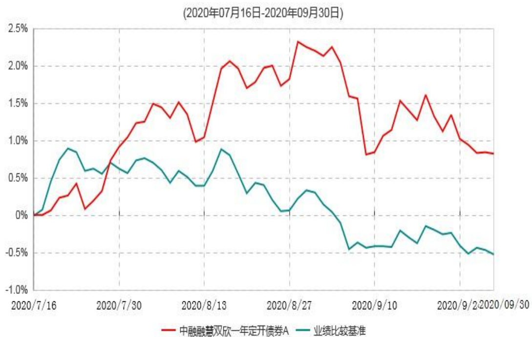
中融融慧双欣一年定开债券A累计净值增长率与业绩比较基准收益率历史走势对比图