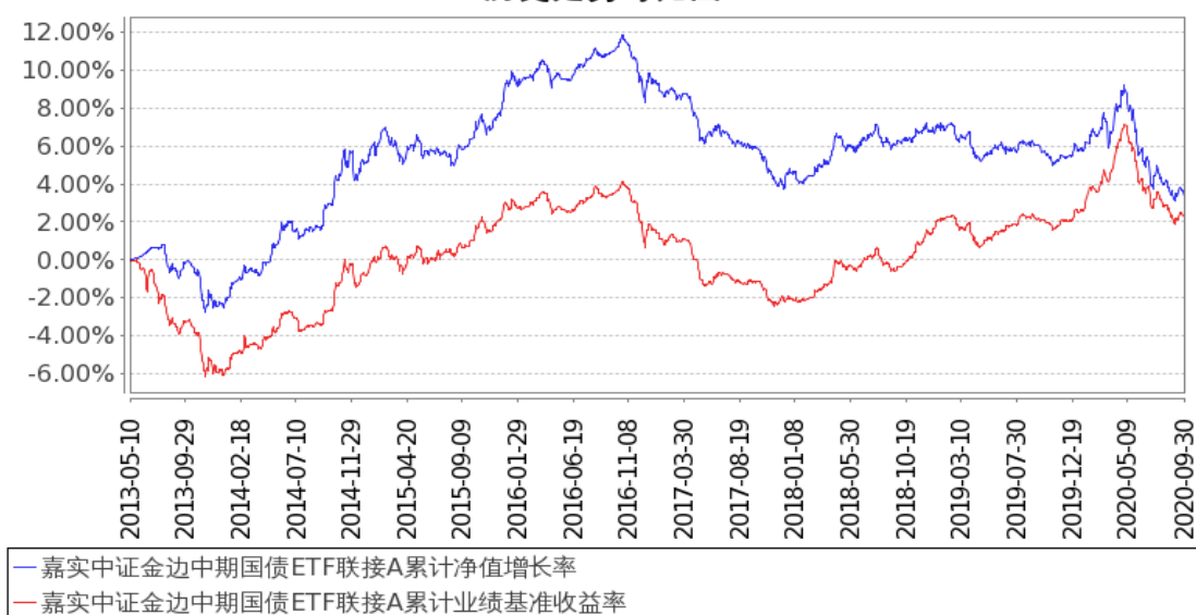
图 1：嘉实中证金边中期国债 ETF 联接 A 基金份额累计净值增长率与同期业绩比较基准收益率的历史走势对比图