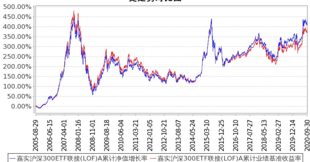
图 1: 嘉实沪深 300ETF 联接(LOF)A 基金份额累计净值增长率与同期业绩比较基准收益率的历史