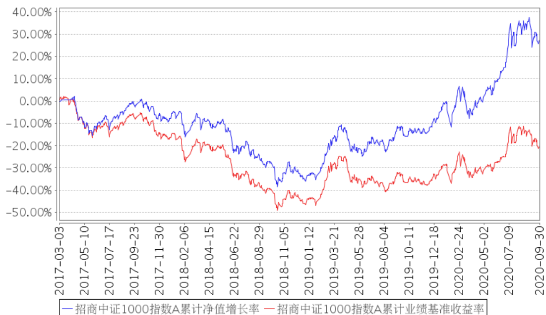
招商中证1000指数A累计净值增长率与同期业绩比较基准收益率的历史走势对比图