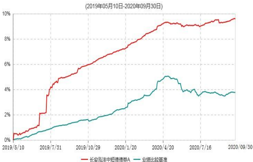
长安泓沅中短债债券A累计净值增长率与业绩比较基准收益率历史走势对比图