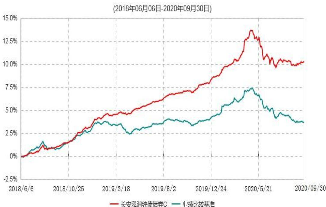
长安泓润纯债债券C累计净值增长率与业绩比较基准收益率历史走势对比图

根据基金合同的规定，自基金合同生效日起 6 个月内基金各项资产配置比例需符合基金合同要求。本基金在建仓期结束后，各项资产配置比例已符合基金合同有关投资比例的约定。基金合同生效日至报告期末，本基金运作时间已满一年。图示日期为 2018 年 6 月 6 日至 2020 年 9 月 30 日。