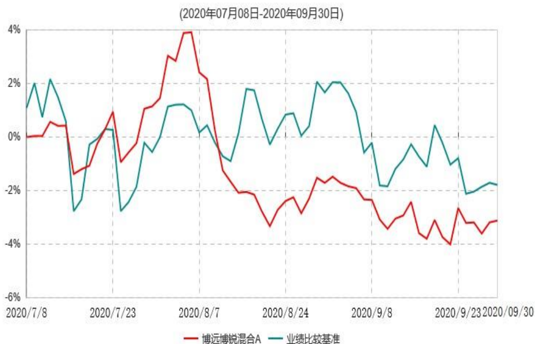
博远博锐混合C累计净值增长率与业绩比较基准收益率历史走势对比图