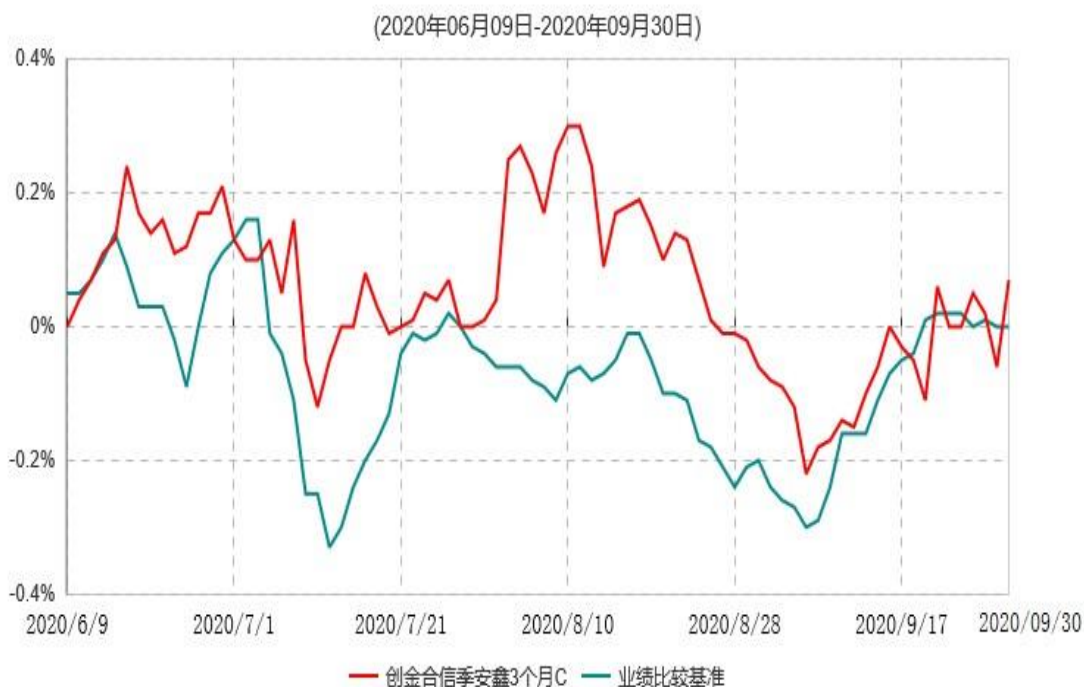
创金合信季安鑫3个月C累计净值增长率与业绩比较基准收益率历史走势对比图