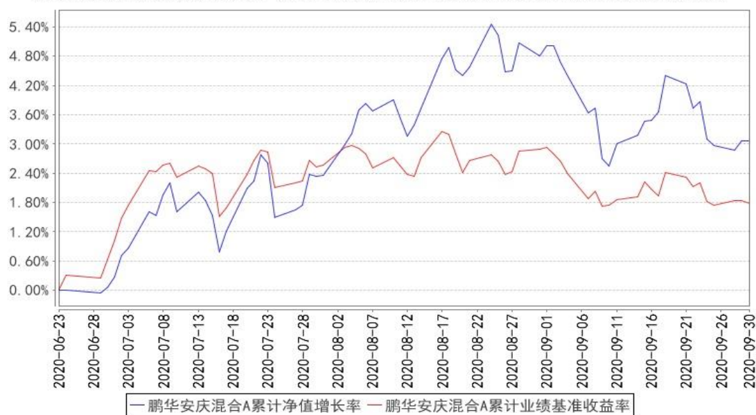
鹏华安庆混合A累计净值增长率与同期业绩比较基准收益率的历史走势对比图